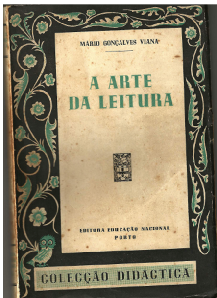
Figura 2. Capa do livro A arte da leitura .