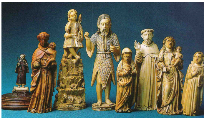
Marfins de Goa – Coleção Mário de Andrade (Col. Artes Visuais, IEB – USP)

percepção reducionista, reforçando o orientalismo no discurso imperialista. Claro está que se trata de uma epistemologia eurocêntrica, todavia carente de novas análises e de releituras a partir de outras interpretações, como o criticismo pós-colonial 23 e o debate dos estudos subalternos da historiografia anglo-indiana. 24 No contexto hispânico, as rotas comerciais do Pacífico e as relações intrainperiais entre portugueses e castelhanos disseminaram o escoamento de mercadorias e padrões culturais do Oriente com evidências documentais no México, Peru e Argentina sobre os vínculos Ocidente/Oriente que se acomodaram e se recriaram no cotidiano das elites coloniais e das ordens religiosas, fenômeno compreensível até porque estas traziam em sua matriz cultural ibérica um componente oriental que sobreviveu como herança moura dos oito séculos da presença árabe na Península Ibérica, tão determinante quanto o mercantilismo, nas readequações e ressignificações dos orientalismos nos espaços coloniais dos reinos ibéricos.