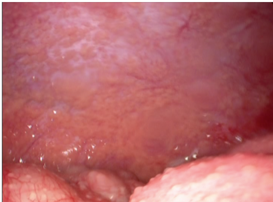
Figura 2 – Retirada da gravação da laparoscopia realizada no caso 2 – mostrando o peritônio parietal recoberto por nódulos amarelados (parte superior da figura) e nódulos sobre o epíplon que recobre as alças intestinais (parte inferior da figura).

A análise histopatológica foi determinante em todos os casos pela demonstração de serosite granulomatosa com necrose caseosa (Figura 3).